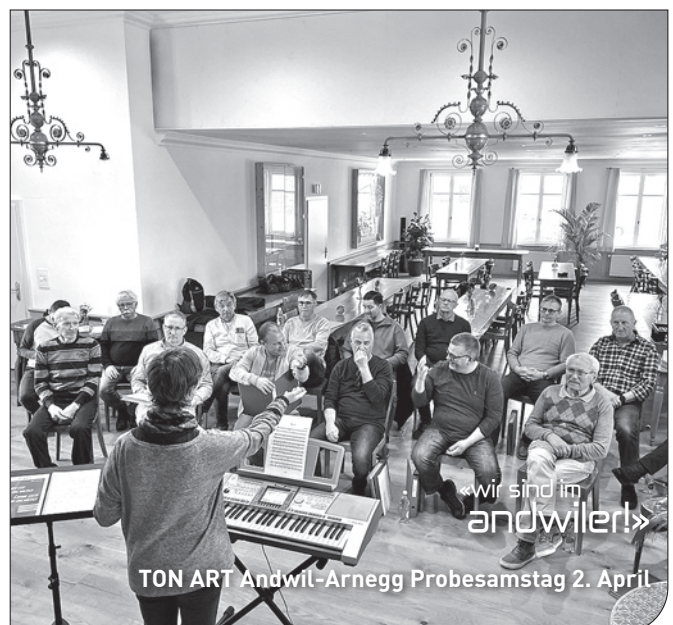
TON ART Andwil-Arnegg Probesamstag 2. April