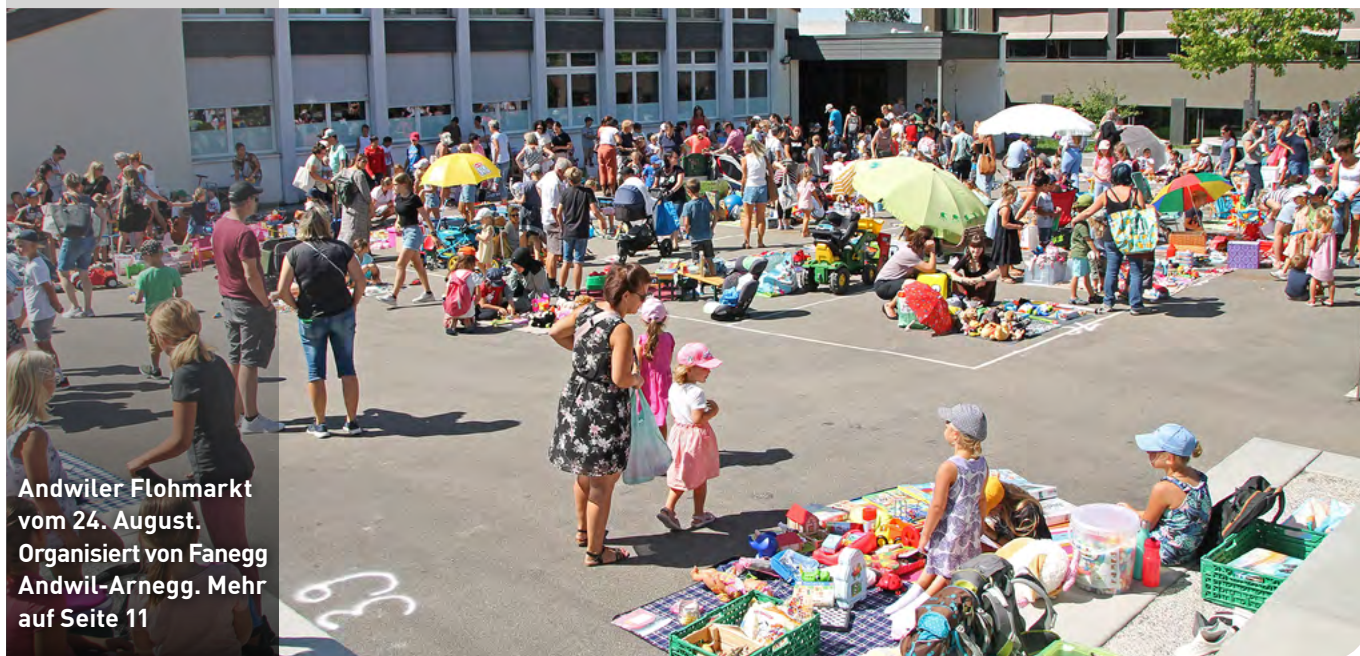
Andwiler Flohmarkt vom 24. August. Organisiert von Fanegg Andwil-Arnegg. Mehr auf Seite 11

71. Jahrgang | GZA | Nr. 17 | Freitag, 2. September 2022