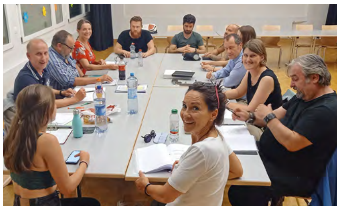
Die Schauspieler/-innen sind fleissig am Proben, damit der Text an der Premiere dann auch sitzt.