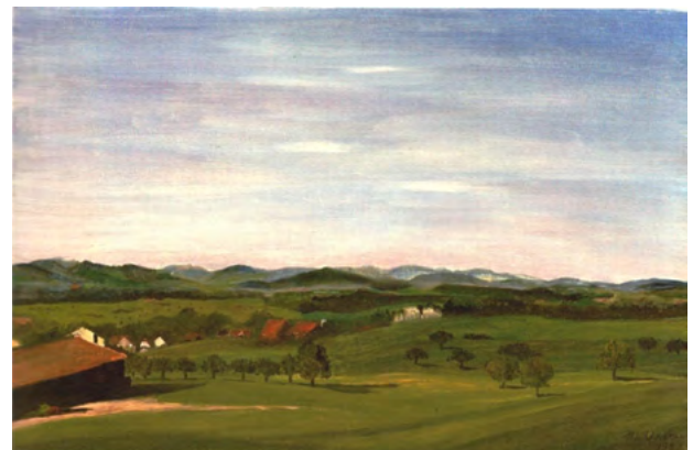
Fürstenland von Andwil aus gesehen

Wir präsentieren eine umfassende Ausstellung zum Schaffen des Andwiler Malers Willy Vestner.