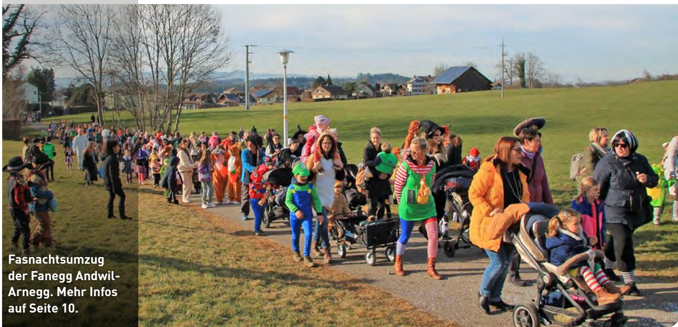
Fasnachtsumzug der Fanegg Andwil-Arnegg. Mehr Infos auf Seite 10.

73. Jahrgang | GZA | Nr. 2 | Freitag, 26. Januar 2024